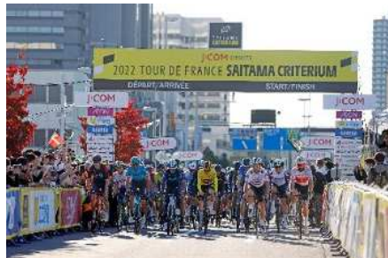
【ツール・ド・フランスさいたまクリテリウム】

さらに、「(一社)さいたまスポーツコミッション」の活動を支援することにより、多様なスポーツ機会を創出し、市の魅力を発信するとともに、地域の活力を生み出していく必要があります。