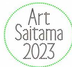
【さいたま国際芸術祭2023】

さらに、市民の多様化する文化芸術活動を支えるため、(仮称)市民会館うらわ等の文化芸術創造拠点の整備を進める必要があります。