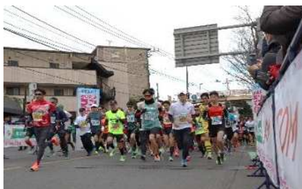
【さいたまランフェス2022-23】